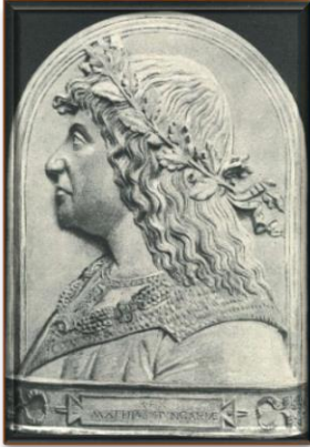
1. ábra - Mátyás király arcképe

Eccer vót, hol nem vót, Kolozsváron vót, amikor Mátyás király lóháton szokott járni, mer ő lovag vót. Vót neki egy öreg fehér lova, s hát ment, s meglátott egy márványtáblát egy nagy épületen. Hát, ki vót arra írva, hogy gond nélkül élünk. Úgy felharagudt a király.